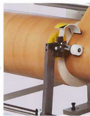
Längsschneideinrichtung am Rollenständer mit einem Kreismesser

Haben Sie eine besondere Anforderung? Josting hat jahrzehntelange Erfahrung in der Entwicklung und Herstellung von Schneidemaschinen. Senden Sie uns einfach Ihr Materialmuster für Probe-schnitte zu, wir beraten Sie gern.