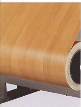
Slitting unit with circular knife on the roll stand.

The top knife moves against the stationary bottom knife in a shearing action. Slitting and cutting to size take place in a single pass. The drive unit for the top knife consists of a brake motor, a gear, a crank mechanism and a rupturing diaphragm. The slitting unit at the infeed drum consists of 3 laterally adjustable holders with cutter blades. The amount of slack is controlled by the pay-off drive in conjunction with a dancer roll.