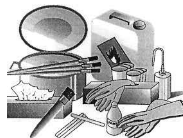
Abb. ähnlich picture similar